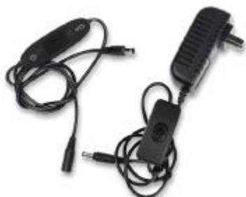
Napájecí kabel a ovladač