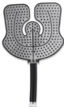
Kompresně chladicí podložka