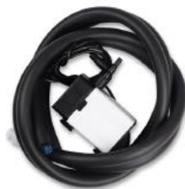
Hadice s pumpou