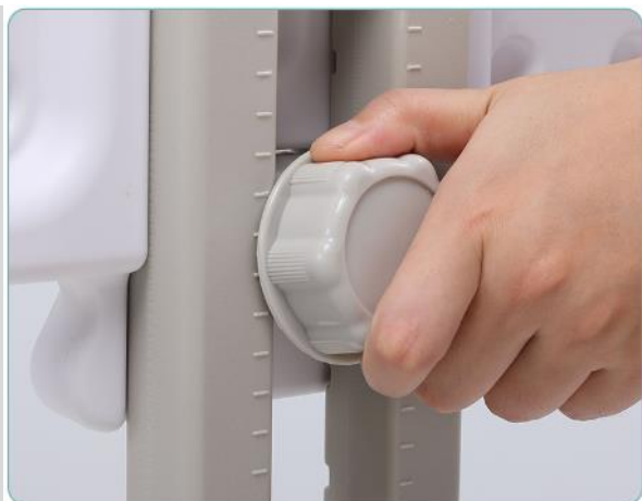
5. Nastavte výšku