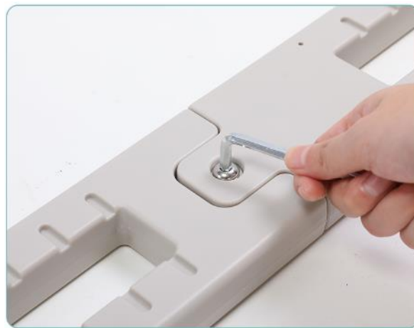
2. Spojte obě části pomocí imbusového klíče