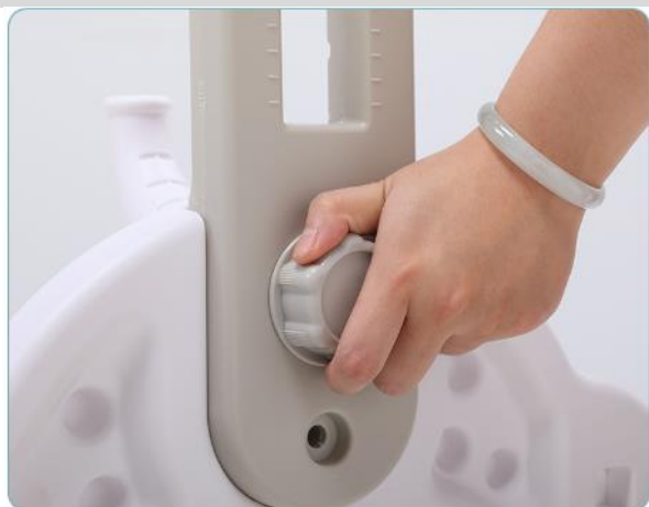
3. Utáhněte ruční šroub