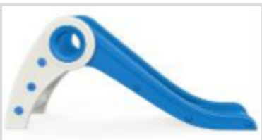
5. Připevněte druhý boční panel a druhou polovinu hlavního rámu