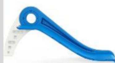
3. Připevněte klouzačku pomocí šroubů