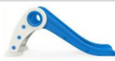
6. Upevněte hlavní rám