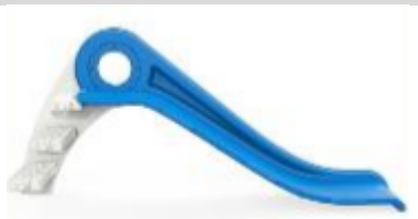
4. Připevněte schody na hlavní rám