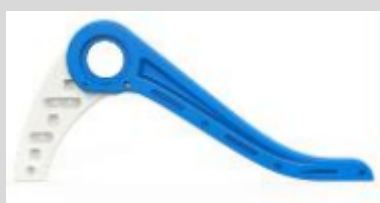
1. Připevněte boční panel s hlavním rámem