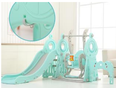
10. Připevněte branku