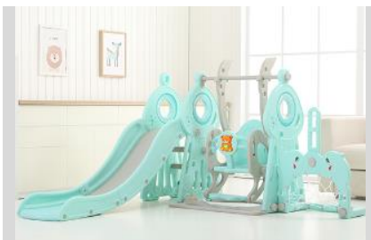
11. Připevněte držák pro obruč