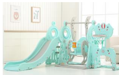
12. Připevněte obruč