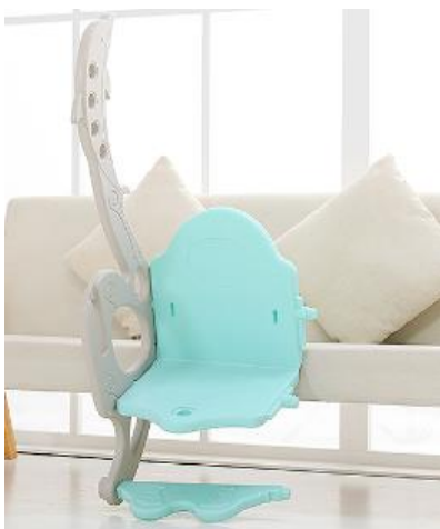
1. Připevněte jednu stranu na houpačku