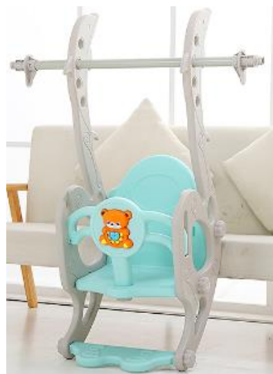
3. Připevněte nosnou tyč