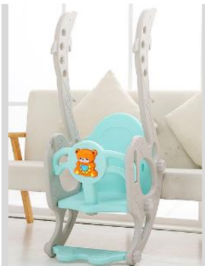
2. Připevněte druhou stranu houpačky